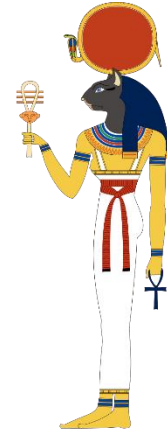
Bastet, een belangrijke Godin tijdens Oud Egyptische tijden

Tegenwoordig wordt de kat vooral als gezelschapsdier gebruikt.