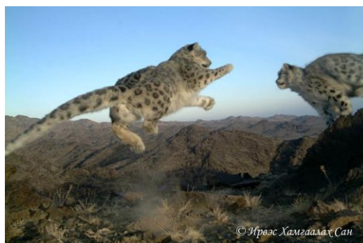
Twee jonge sneeuwluipaarden aan het spelen