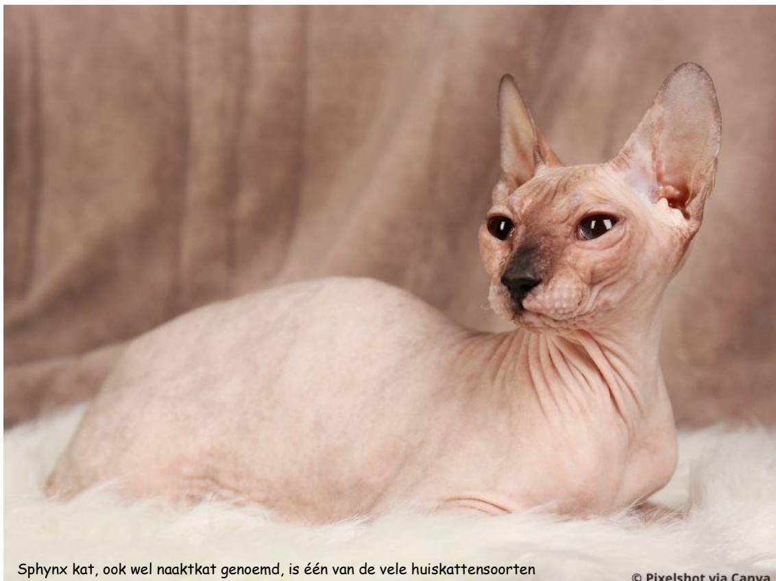
Sphynx kat, ook wel naaktkat genoemd, is één van de vele huiskattensoorten